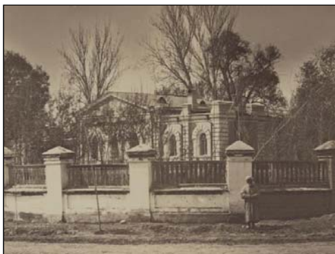
Дом военного губернатора Сыр-Дарьинской области в Ташкенте. Фотография 1860-х годов

Скончался наш герой в 1885 году, на три года пережив своего туркестанского «друга» Михаила Дмитриевича Скобелева. Был отпет в усть-каменогорской Троицкой церкви (сейчас она